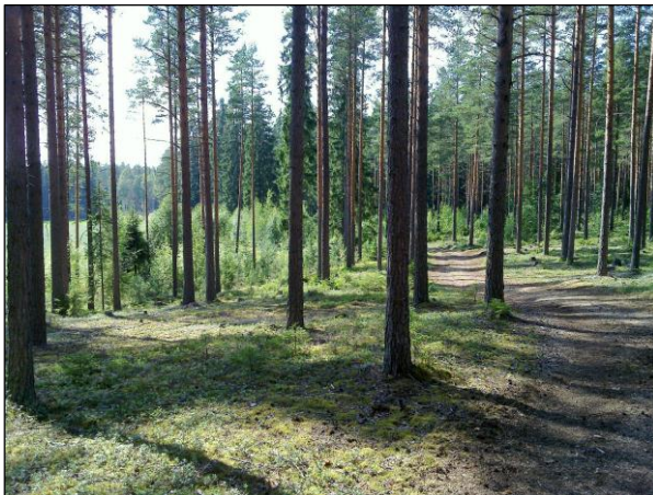
Alueen luoteisosaa luoteeseen

Alue hoidettua kangasmetsää. Ei uusia havaintoja. Vaikuttaa olevan kunnossa. Rajaus lienee arvio hyvällä varmuustoleranssilla. Muualla alueella en havainnut muinaisjäännöstä.