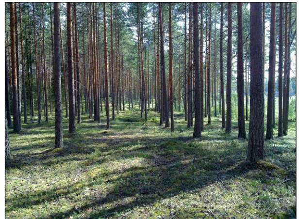
Alueen eteläosaa etelään