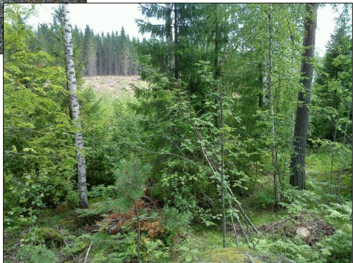
Asuinpaikkaa kalliolta Kaakkoon.