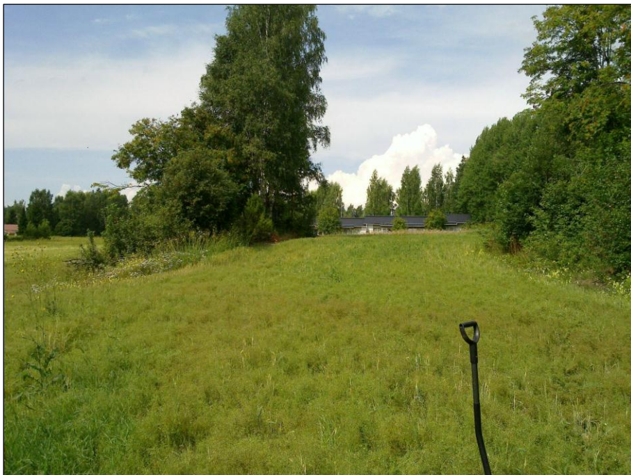
Löydöt peltosaarekkeen ja metsän väliltä. Kuvattu luoteeseen

Paikalla käydessäni pelto harvalla oraalla. Saattoi havainnoida kohtuullisesti. Mitään esihistoriaan viittaavaa en alueella havainnut. Alueen rajaus hyvin epäselvä.